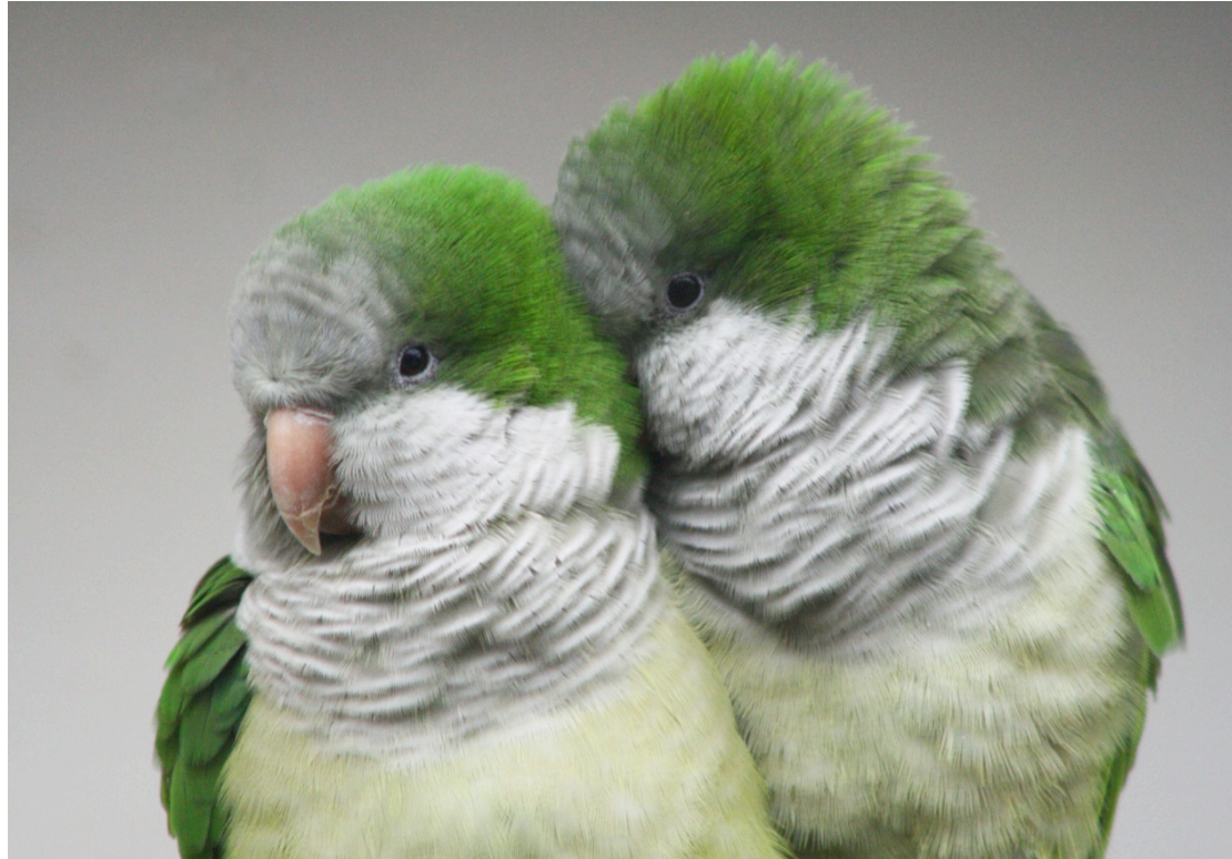
Cotorra argentina